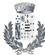
Santo Stefano di Camastra