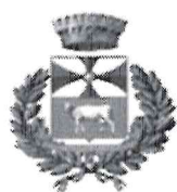
Castel di Lucio